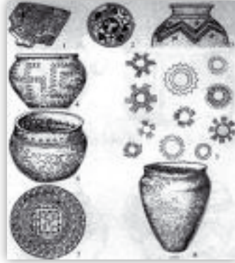
Saksı kaplar (çömlekler)

Yazarı belli olmayan “ცხოვრება ქართველთა მეფეთა” (Tshovreba Kartvelta Mepeta / Gürcü Krallarının Hayatı) salnamesinde [6] Türkler adıyla 28 ailelik tayfanın Mesket’te (Meskûtlarla ilgili olabilir) yerleştiği, İverlerle (eski Gürcülerle) dostça yaşadığı, Sarkın şehrini inşa ederek şenlendirdiği bildirilmektedir.