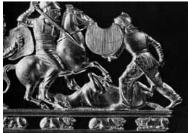
İskitlerin savaşı (taraktan)