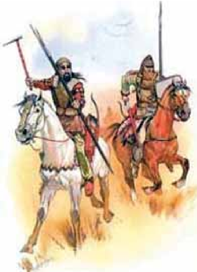
İskit savaşçıları Gürcistan'da

Sonda Gürcü tarih kitaplarında yer alan iki resmi de sunuyoruz: