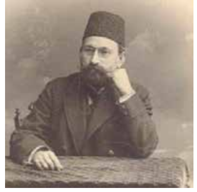
Hüseyinzade Ali Bey.

Yıllardan beri dillerde heyecanla terennüm edilen Karadeniz Marşı veya türküüsü/şarkısı adıyla anılan manzumenin şairin kaleminden çıkmış aslını ilk defa görüyoruz. Mevcut yazılış ve söyleyişlerde bazı farklılıklar görülmektedir. Bu şiiri kaleme alan Azerbaycanlı merhum şehit şâirimiz Ahmed Cevad (1892-1937)'in el yazısını internette gördük. Yazılışının 100. Yıldönümü münasebetiyle şiirin orjinal şeklini okuyucularımıza sunuyoruz.