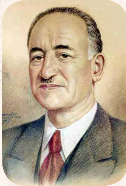
M. Emin Resulzade.

Bakü'yü elinde tutan Kızıl Ermeni kuvvetleri, yaklaşan tehlikeyi Bakü'nün dışında etkisiz hâle getirmek ve Tiflis'le bağlantıyı sağlamak amacıyla Gence'ye doğru hareket etti. Geçtiği köy ve kasabaları yakıp yıkarak Gökçay'a kadar ilerlediler. 30 Haziran'da cereyan eden Gökçay muharebesinde Ermeni kuvvetlerinin bir kısmı imha edildi, bir kısmı geri çekildi. Bakü'ye giden yol üzerinde mevzilenen Ermeni kuvvetleri Aksu, Kürdemir ve Şamahı muharebelerinde de hezimete uğrayarak Bakü içlerine çekilmek zorunda bırakıldı. Temmuz ayı, Gence-Bakü ana caddesi üzerinde yapılan muharebelerle geçti. O günlerde Bakü'de fecî bir açlık yaşanıyordu. Rus ve Ermeni gibi Hristiyan unsurlar İngilizleri, Müslüman nüfus da Türklerin gelmesini bekliyordu.