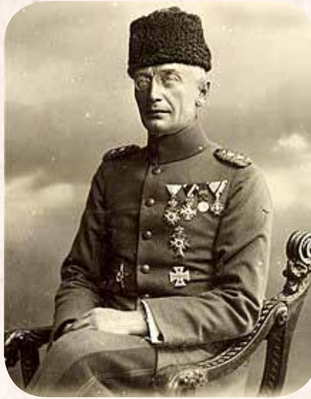
Von Kressenstein 1916.