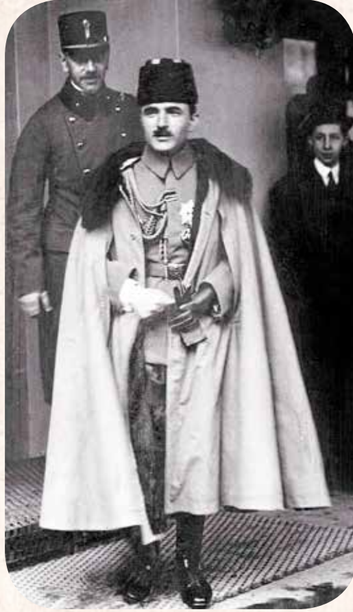
Genç Kumandan Enver Paşa.

Enver Paşa , bir kısmı Türk olmak üzere nüfusunun çoğu Müslüman topluluklardan meydana gelen Kafkasya'ya ayrı bir önem atfetmekteydi. Çarlığın yıkılmış olması, bu coğrafyadaki toplulukların uyanıyor olması ve Türkiye'ye sempatiyle bakması, fırsat olarak değerlendirilebilirdi. İstanbul o günlerde,