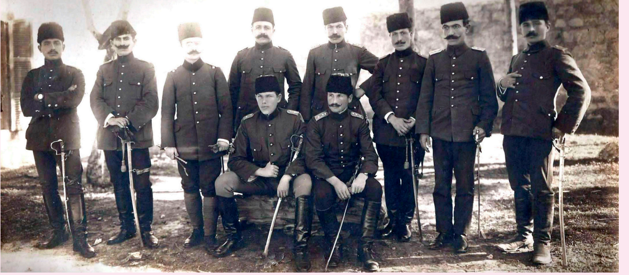
27 Aralık 1914'te Ardahan'a giren Teşkilât-ı Mahsusa kuvvetlerini idare eden Alman asıllı Albay Stange, Halid Paşa (oturanlardan sağdaki), Yakup Cemil, Bahaeddin Şakir gibi isimlerin yer aldığı subayların Ardahan hatırası

Millî Mücadele tarihimizin unutulmaz kahramanlarından olan Deli 1 Halid Paşa, Kastamonulu bir ailenin çocuğu olarak 1883 yılında İstanbul'da dünyaya gelmiştir. Osmanlı Devletinin buhranlı yıllarını yaşamış, Trablusgarp ve Balkan savaşlarında yer almış, I. Dünya Savaşı'nda Kafkas Cephesi'nde büyük başarılar göstermiş; Kurtuluş Savaşı'nın ilk yıllarında Doğu cephesinde, Gümrü Antlaşması'nın imzalanmasından sonra da Batı cephesinde savaşmıştır. Kahramanlığı ve cesurluğu hâlen daha dilden dile anlatılmaktadır. O, bilhassa Kars, Ardahan ve Artvin yörelerinde efsanevi bir kahramandır. TBMM'nin II. Döneminde mebusu olarak Ardahan'ı temsil etmiştir.