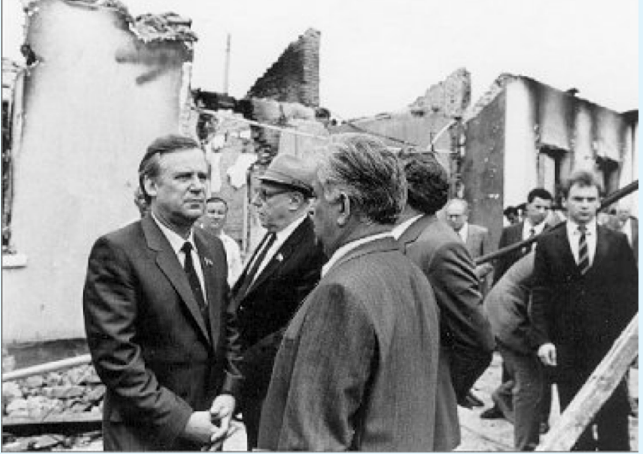
Sovyetler Birliđi Bařbakanı Nikolay Rıjkov Fergana'da

münferit olaylar dıřında önemli havadis kaydedilmemiřti. Askerler çok kararlı řekilde ve sert hareket ediyorlardı. Margilan'da sokađa çıkma yasađını ihlâl eden bir sürücü, devriye gezen askerlere direnince öldürülmüřtü (33).