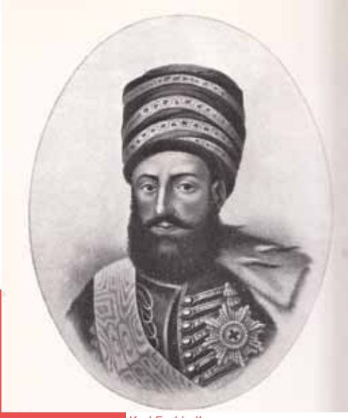
Kral Erekle II.

Semerkant ve Kokant'ın işgalini tamamladılar. Ruslar, ele geçirdikleri ülkelerin verimli arazilerinde yaşayan yerli ahaliyi buradan uzaklaştırarak yerlerine Rus nüfusu yerleştiriyorlardı. Ruslar, bugün birçok ülkeden meydana gelen ve Orta Asya diye andığımız coğrafyayı, kolay idare etmek için sun'i sınırlarla parçalamıştır. Hâlbuki bu coğrafya, 1865 yılında Türkistan Genel Valiliği olarak Çarlık Rusya'sına tâbi kılınmıştı. Nüfus konusunda ibretli bir örnek vermek gerekirse, Kazakistan'a bakmamız yeter. Bu ülkede seksen yıl içinde nüfus yapısının nasıl değiştiğini şu yüzdeler tablosunda açıkça görebiliriz: