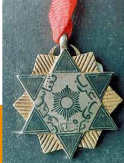
Cenubigarbî Kafkas Hükûmeti arması.