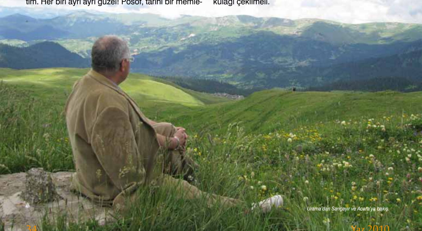
Urama'dan Sarıçayır ve Acara'ya bakış.

Sözü uzatmaya gerek yok! Posof göçü yenmeli! Posof'un tarihinden, coğrafyasından ve problemlerinden habersiz siyaset bezirgânlarının da kulağı çekilmeli.