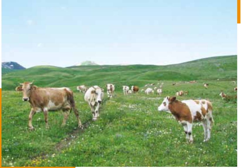
Posof - Urama Yaylası.

Gürcü tarihlerinde Jakeli-Atabago diye geçen