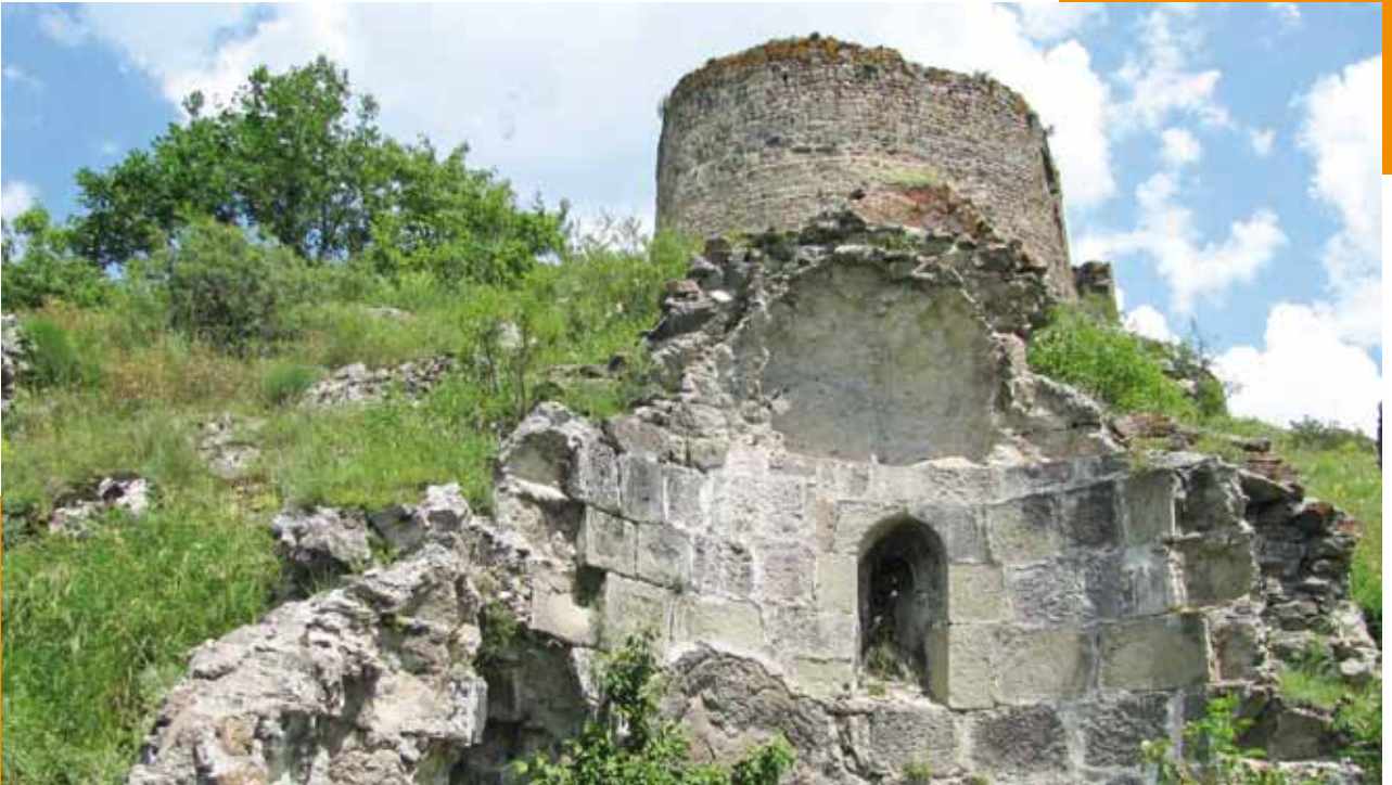
Cak Kalesi ve Manastırı.