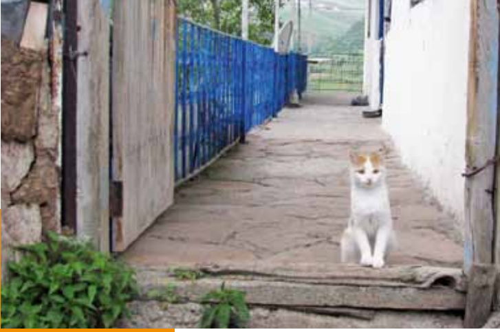
Xertus'tan bir enstantane.

Şimdi önümüzde burada zikrettiğim köylerin yaylaları var. Bu yaylaları aşip Ğırma Dağına ulaşacak, oradan da Sece'ye ineceğiz.