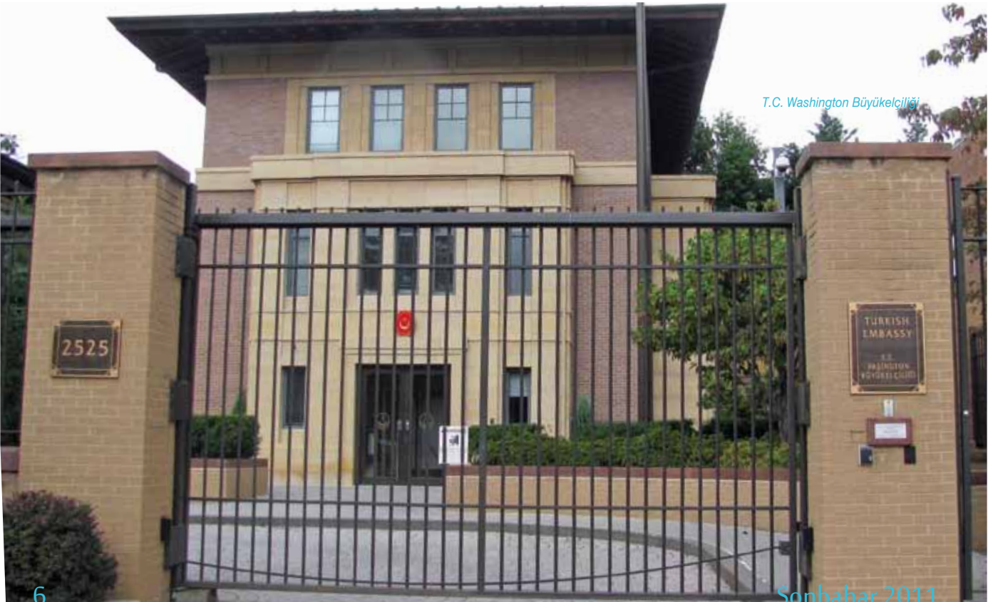
T.C. Washington Büyükelçiliği

ve aynı zamanda kendileri de millî hislerle dolma bakımından fevkalâde örnek bir çalışmaydı. İçinde yaşadıkları eyaletin resmî zevatını, üniversite yetkililerini, oradaki Türk resmî ve sivil toplum misyonunu bir araya getirmek gibi başarılı bir organizasyonu alkışlıyor; bundan sonra yapılacak bu tür faaliyetlerde kendilerinin daha çok rol almalarını diliyoruz.