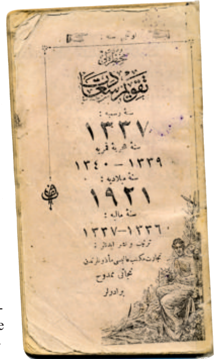
Muhtıralı Takvim-i Saadet - 1921